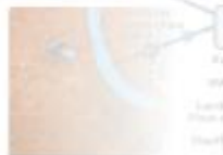
Galerie in Artropol