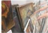
Dund Bildender Künstlerinnen Württemberg