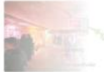
Dunkler unter dem Licht